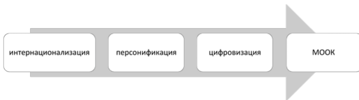
Рисунок 1 – Становление массовых открытых онлайн-курсов

Представим технологический процесс становления массовых открытых онлайн-курсов на рис. 1.