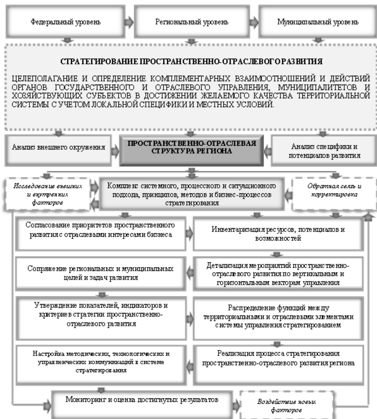
Рисунок 2 – Механизм стратегирования пространственно-отраслевого развития региона

– сопряжение федеральных, региональных и муниципальных целей и задач пространственно-отраслевого развития;