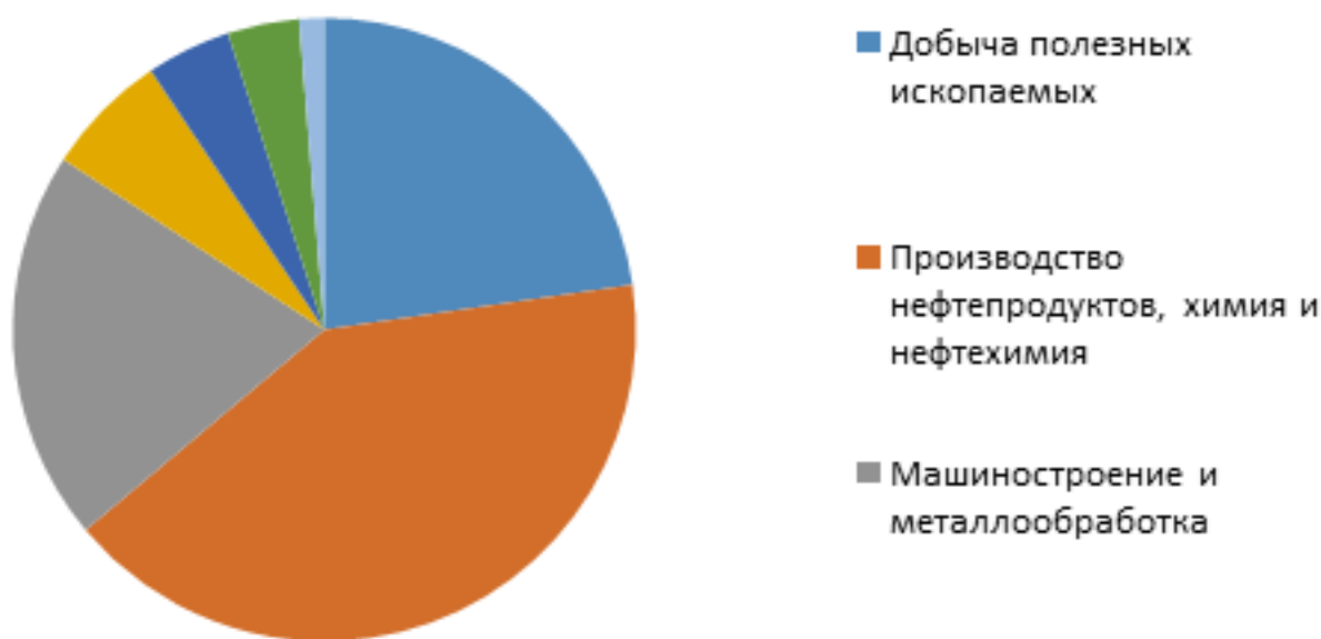
Рисунок 2 – Структура промышленности Республики Татарстан в 2022 г., %

Добыча и переработка нефти и газа являются основными отраслями экономики Татарстана, а также основой для развития связанных с ними отраслей. По данным на 2021 г., нефтегазовый комплекс составляет более 30 % валового регионального продукта.