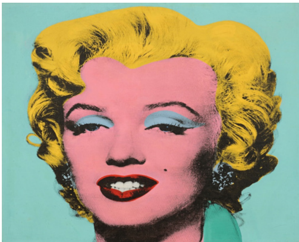
Рисунок 1 – Портрет Мерлин Манро, выполненный Э. Уорхолом

Когда портрет Мэрилин Монро, выполненный Энди Уорхолом (рис. 1), неоднократно предстал перед зрителем в большом масштабе, шок от имидж-арта также положил начало новой эпохе, не только повторной, но и огромной по своим размерам [8].