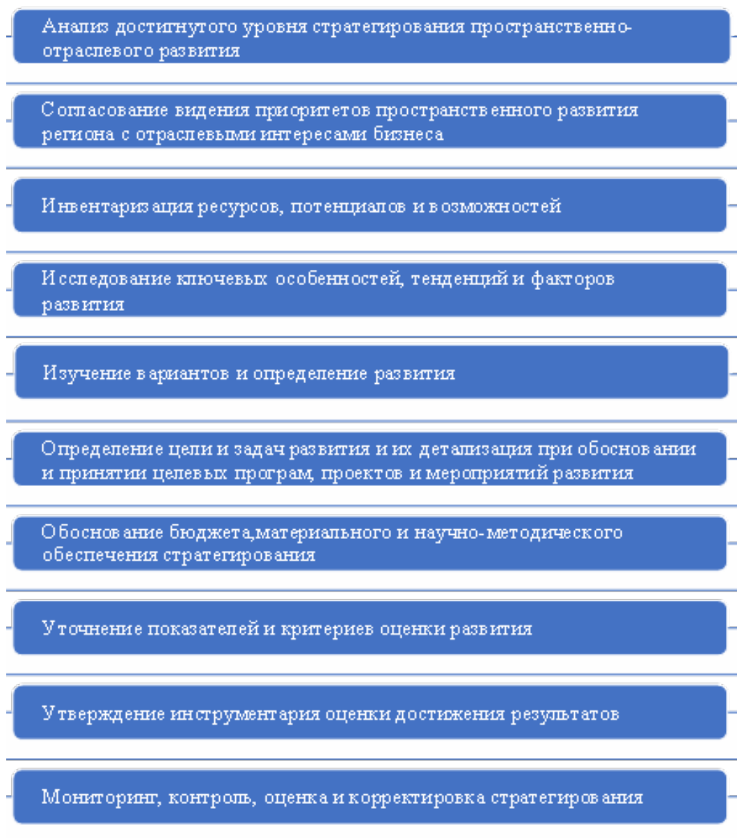
Рисунок 1 – Основные процессы стратегирования пространственно-отраслевого развития региона

Анализ содержательного наполнения реализуемых в настоящее время стратегий развития на уровне федеральных округов и регионов России позволяет отметить факт определенного дисбаланса комплекса направлений и мероприятий в пользу пространственного направления и в ущерб отраслевой составляющей. Безусловно, данный феномен объясняется приоритетом преодоления межрегионального и межтерриториального неравенства как первоочередной задачи социально ориентированной политики Российской Федерации, а также отсутствием единых требований по содержанию и структуре стратегий. В силу чего перед разработ-